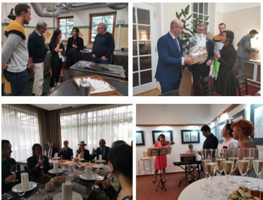
Obrázek č. 74–77: Slavnost města

Celkové náklady na akci cca 220.748,97 Kč