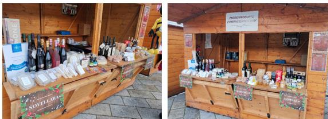
Obrázek č. 84–85: Adventní jarmark 2019

Celkové náklady na nákup produktů cca 31.626,60 Kč