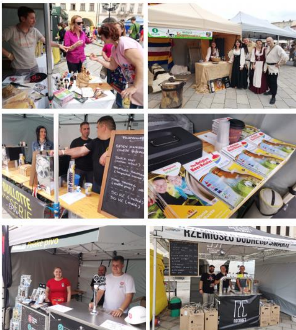
Obrázek č. 68–73: Pivobraní

Celkové náklady na akci cca 115.039,56 Kč