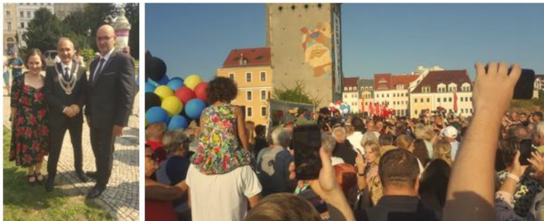
Obrázek č. 58–59: Altsdatfest