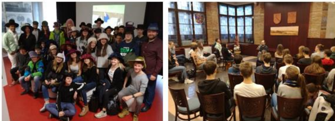
Obrázek č. 60–61: Výměnný pobyt

Celkové náklady na přivítání studentů a dary cca 3.295,40 Kč