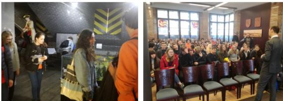
Obrázek č. 66–67: Výměnný pobyt