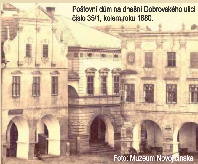
Poštovní dům na dnešní Dobrovského ulici číslo 35/1, kolem roku 1880.